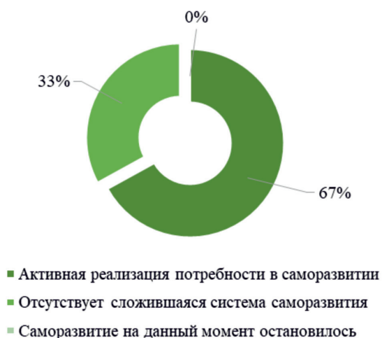
Рис. 2. Процентное распределение респондентов по уровням реализации потребностей в саморазвитии

Молодых людей с уровнем «саморазвитие на данный момент остановилось» в данном исследовании выявлено не было (0%). В качестве субъективных препятствий становления системы саморазвития личности выделяют: постановку ошибочных жизненных целей, отсутствие выработанных индивидуальных приемов саморазвития, недостаточность личной мотивации, неоптимальный уровень самооценки, доминирующие или конформные способы взаимодействия с окружающими.