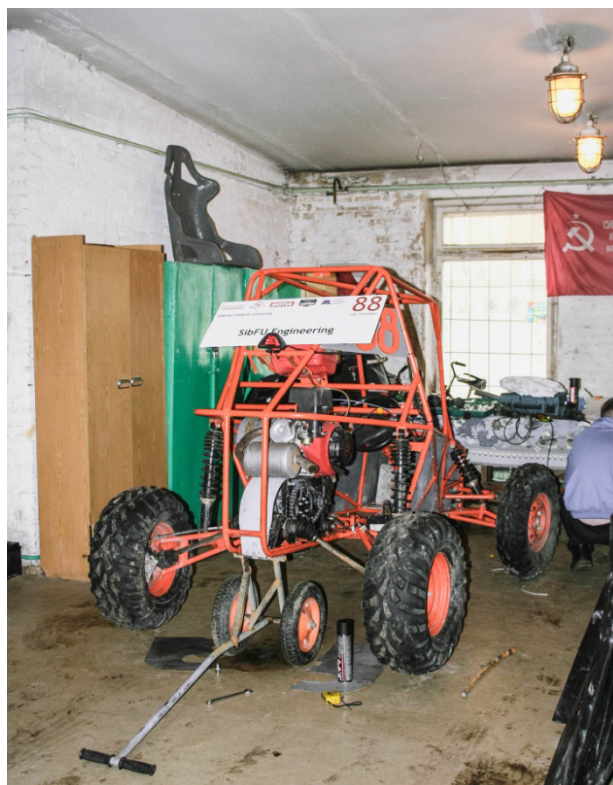
Рис. 3. Сборка болида студентами БГТУ им. В.Г. им. Шухова

Формула SAE – это студенческие инженерные соревнования, учрежденные несколько десятилетий назад Сообществом автомобильных инженеров (Society of automotive engineers, SAE). По замыслу отцов-основателей, команда студентов вуза является инженерной компанией, которая самостоятельно разрабатывает, изготавливает и испытывает прототип автомобиля формульного класса для рынка непрофессиональных гоночных машин. Тестом для будущих специалистов является уже сама по себе постройка болида, который сможет на соревнованиях соответствовать всем строгим требованиям. При этом команда должна представить судьям всю конструкторскую документацию и доказать, что примененные технические решения являются наиболее оптимальными. Разработчики при этом обязаны помнить, что в итоге им предстоит «продать» свой автомобиль по конкурентной цене, представив, кроме прочего, бизнес-план на мелкосерийное производство машины.