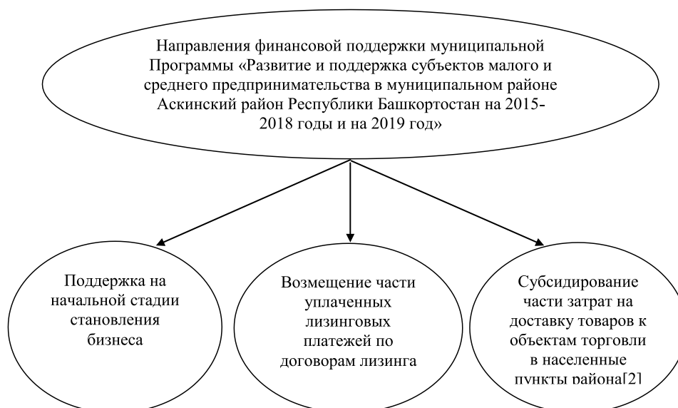
Рис. 1. Виды поддержки

Так же наблюдается рост среднесписочной численности работников у СМП на 2,9%, при этом количество трудоспособного населения сократилось на 248 человек (2,5%). По этим данным можно фиксировать рост эффективности деятельности рассматриваемых субъектов. Качество исполнения рассматриваемой программы представлено в табл. 2.