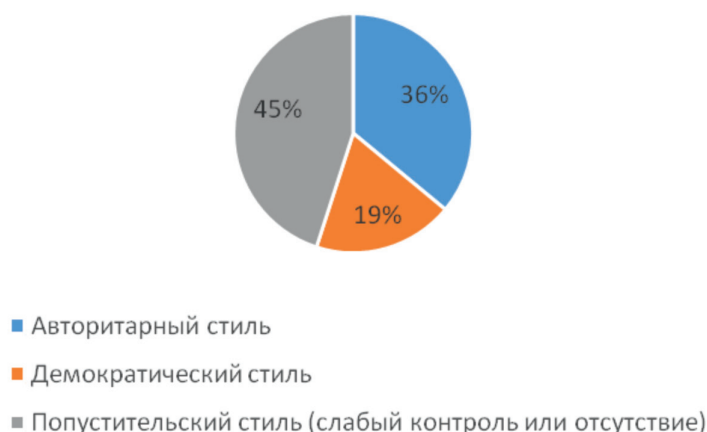
Рис. 1. Диаграмма стилей воспитания

Как видно на рис. 1, у 19% опрошенных был выявлен в качестве доминирующего демократический стиль семейного воспитания, у 36% – авторитарный, у 45% – попустительский (слабый контроль или его отсутствие). Обратившись к анализу полученных результатов, можно сделать вывод, что большинство родителей следуют попустительскому (45%) пути воспитания, на втором месте – авторитарный стиль (36%) и в меньшинстве – демократический (19%).