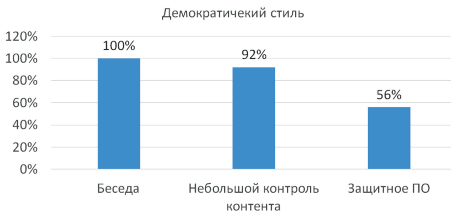
Рис. 2. Диаграмма распределения ответов на вопросы анкеты родителей с демократическим стилем воспитания