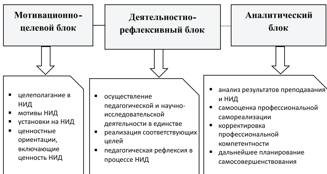
Рис. 2. Модель профессиональной самореализации педагога посредством научно-исследовательской деятельности

Исходя из существующих в науке определений, мотивация как процесс – это совокупность механизмов, обеспечивающих побуждение к конкретной деятельности и определяющих ее направление и способы ее осуществления. Со структурных позиций мотивацию рассматривают как совокупность факторов или мотивов, с учетом которых происходит формирование намерения и принятие решения. Ученые выделяют разные мотивы, побуждающие человека к осуществлению трудовой деятельности. Эти мотивы можно разделить на группы. Е.П. Ильин приводит три группы мотивов, связанных с трудовой деятельностью: